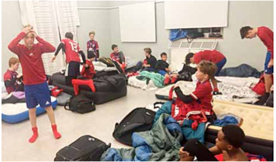
Härligt stökigt klassrum med peppade killar som gör sig i ordning för cupens första match.

Kan varmt rekommendera denna cup. Bra organiserat, kort resväg och vi fick möta lag vi vanligtvis inte möter. Vi spelade på gräsplan, blöt oktobergräs, vilket är en utmaning i sig men killarna anpassade sig snabbt och vi gick ur seriespelet med en vinst, en förlust och en oavgjord match. Det gjorde att vi tog oss vidare till A-slutspel. I åttondelsfinalen åkte vi tyvärr ut mot ett Akademi lag, Sangre Chilena FK. Det var en tuff match, vi hade en taktik som gjorde det svårt för motståndarna men tyvärr räckte det inte hela vägen. Vi känner oss nöjda med vår insats förlusten till trots och de vi förlorade vann finalen för vår åldersklass.